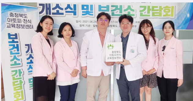
개소식 기념 현판식

코로나로 인하여 온라인으로 개소식을 진행하게 됐지만 적극적인 관심과 참여로 협조해주신 질병관리청 충청북도청, 충청북도교육청, 보건소 및 유관기관 관계자분들에게 다시 한번 깊은 감사를 드립니다.